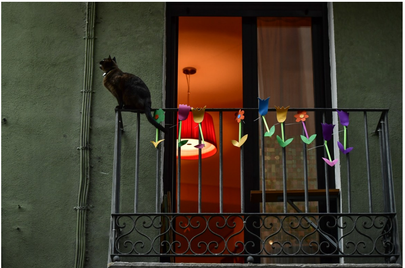
Un balcone a Pamplona

Solo la Mudanjiang Ciy Mega Farm, una fattoria gigante situata nel nord-est della Cina, che contiene centomila vacche la cui carne e il cui latte sono destinati al mercato russo, è cinquanta volte più grande della più grande fattoria bovina dell'Unione europea.